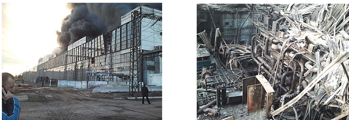
Рис. 1. Фото пожара на Углегорской ТЭС и вид блока ТЭС после пожара

Из горючих материалов, по данным статистики пожаров на АЭС, наиболее опасными являются масла и нефтепродукты, электрооборудование (ЭО), пластмассы, дерево, изоляция кабелей, другие горючие жидкости и горючие газы (водород) [11]. В машинных залах АЭС горючие материалы (турбинное масло и водород) находятся в герметичных оболочках, и их взаимодействие с кислородом воздуха возможно только при разгерметизации. При таких пожарах горит разлитое и фонтанирующее масло, как факел горит водород. Обычно возникновению пожаров в машинных залах АЭС предшествуют аварии турбогенераторов (ТГ) [8, 12]. Следствием подобных пожаров, как правило, является обрушение металлических ферм и покрытий на оборудование, что, в свою очередь, приводит к нарушению герметичности маслосистем и к образованию новых очагов горения. Пожары в машинных залах АЭС и ТЭС развивается аналогично. На рис. 1 приведено фото пожара на Углегорской ТЭС (29.03.2017 г.) и вид блока ТЭС после пожара.