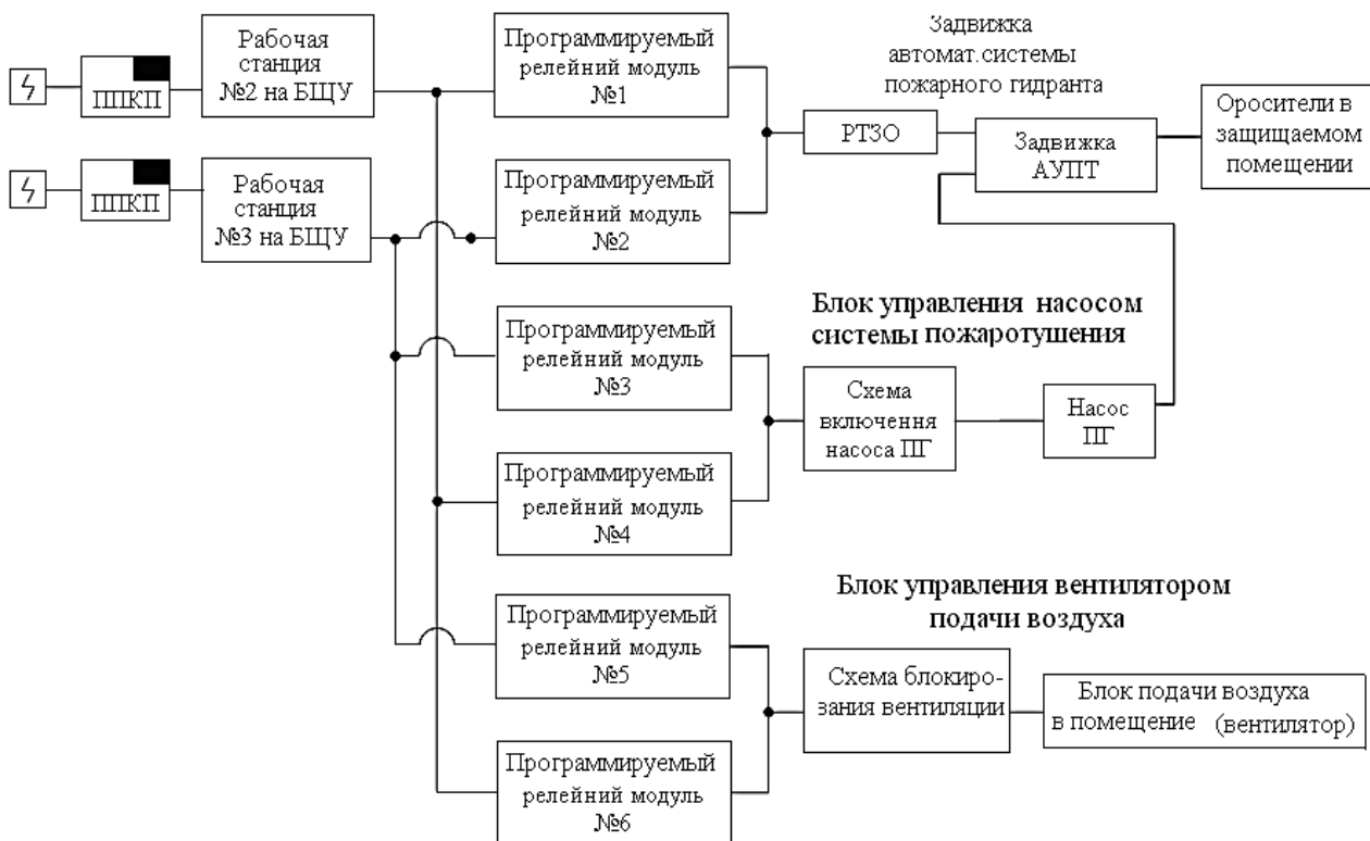
Рис. 4. Функциональная схема предлагаемой автоматической установки обнаружения и тушения пожаров в машинном зале

Кроме функциональной зависимости при расчете должны учитываться временные факторы, которые снижают вероятность безотказной работы. Временная зависимость надежности существующей и предлагаемой схемы АУПГ за 9 лет эксплуатации представлена на рис. 5.