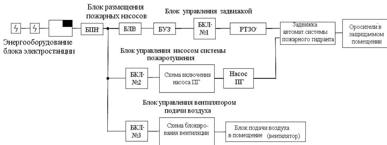
Рис. 2. Функциональная схема существующей автоматической установки обнаружения и тушения пожаров в машинном зале электростанции

Модель работы установки пожаротушения для прогнозирования вероятности ее отказа в определенный отрезок времени выполнялась для задвижек каналов водяного пожаротушения, для систем запуска пожарных насосов и систем блокировки вентиляционных каналов. В настоящее время в машинных залах блоков станций используют автоматические установки обнаружения, тушения пожара и установки управления пожарными гидрантами (АУПГ), функциональная схема которых представлена на рис. 2.