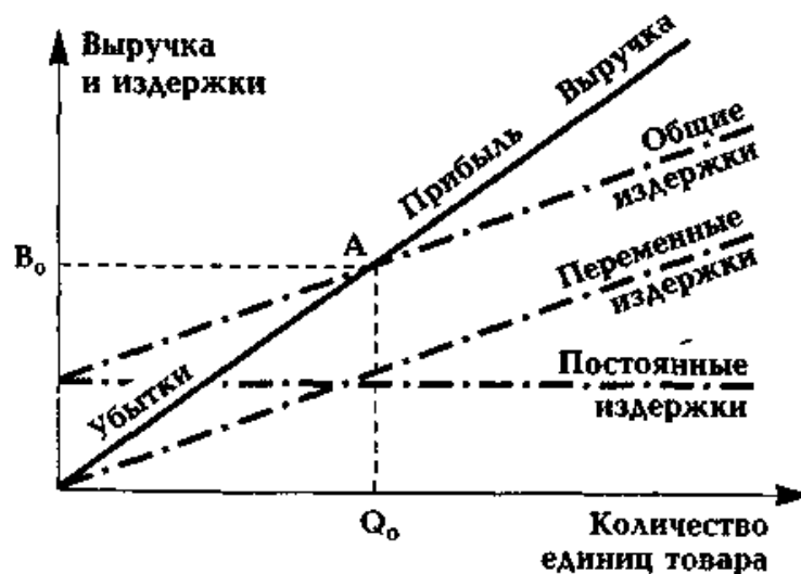
Малюнок 1 - Розрахунок точки самооплатності в бізнес-плані. А — точка самооплатності бізнес проекту.

Капіталовкладення вважаються привабливими, якщо НД_В більше ССКК. Чим вище показник НД_В , тим вище інтерес інвесторів до проекту капіталовкладень підприємства. Ставка дисконту (внутрішня норма прибутковості), рівна середньозваженої вартості капіталу, конкретно означає наступне: