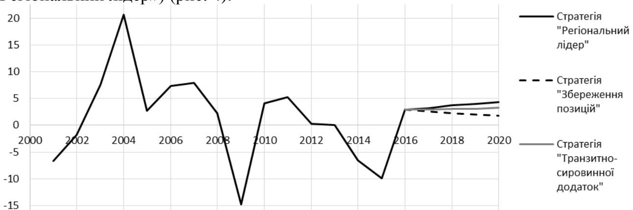
Рис. 4. Прогноз зростання ВВП України 2017-2020 рр. (% до попереднього року)

прогнозування середньорічне зростання ВВП України в описаних стратегіях складе від 1,2 % (стратегія «Збереження позицій») до 4,0 % (стратегія «Регіональний лідер») (рис. 4).