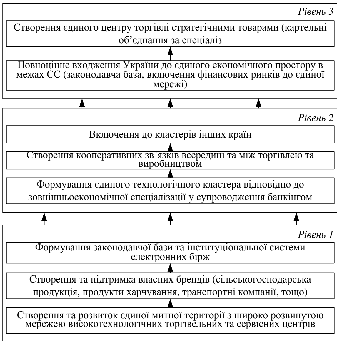
Рис. 3. Модель кластерної економічної інтеграції

Необхідні коригуючі заходи по приведенню в норму ходу інтеграційного процесу може бути здійснене за допомогою інтенсифікації прямих господарських зв'язків між підприємствами взаємодіючих країн в форматі виробничо-фінансових і торгових об'єднань холдингового типу, спільних підприємств, консорціумів, кластерних структур, тощо. Модель кластерної економічної інтеграції національних економік повинна бути багаторівневою, включати кілька етапів розвитку співробітництва, що відрізняються різним ступенем взаємопроникнення національних економічних систем країн угруповання (рис. 3).