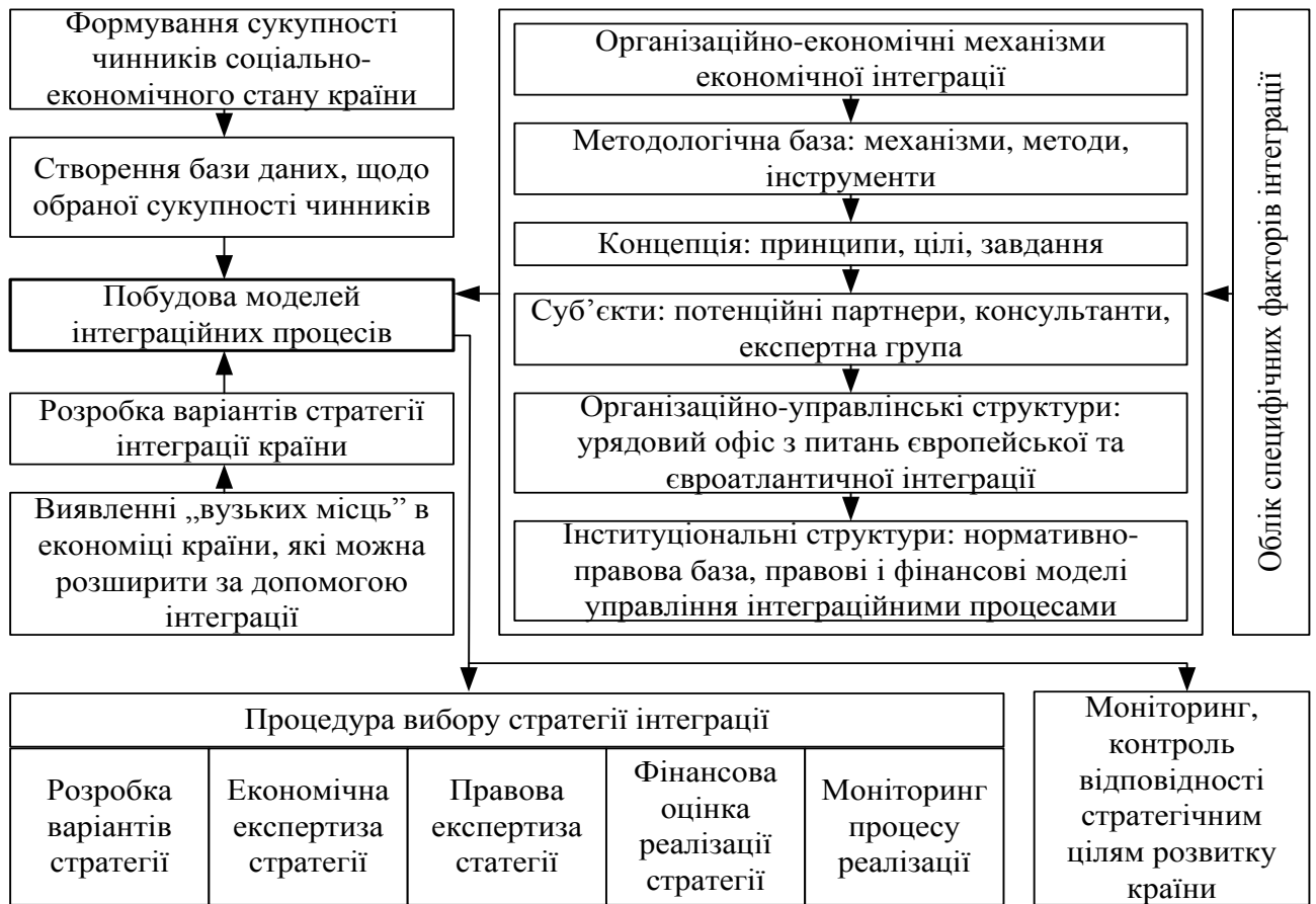
Рис. 5. Організаційно-економічний механізм державного регулювання інтеграційними процесами