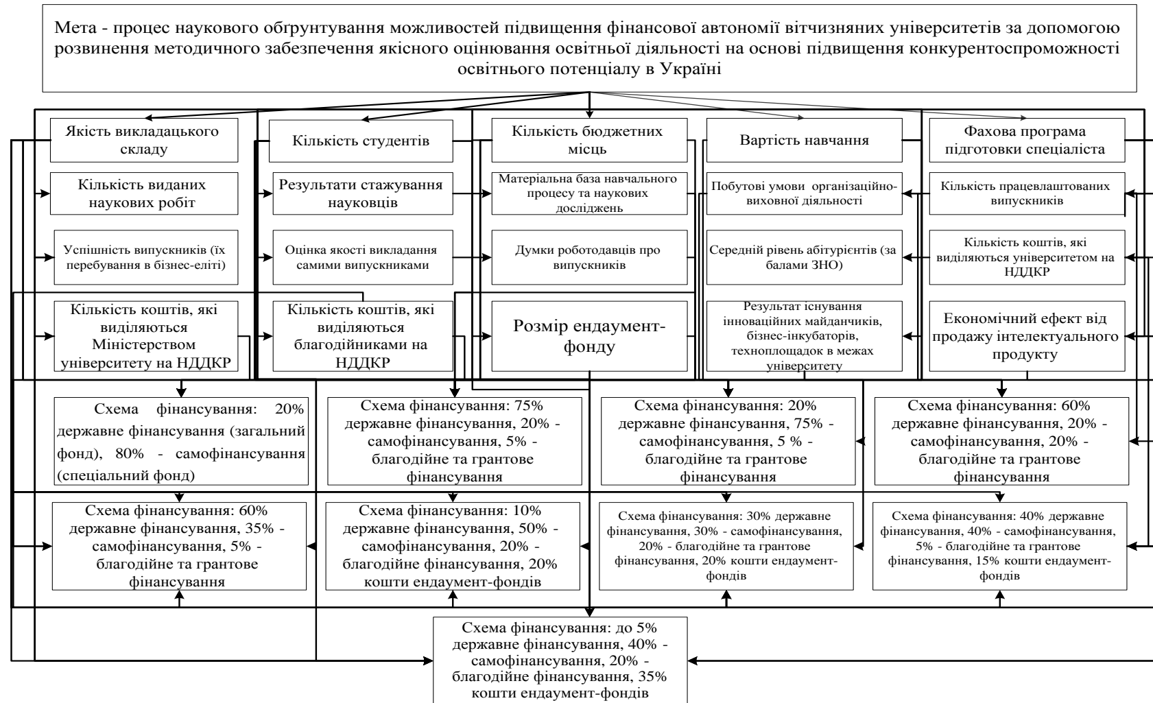
Рис. 4. Загальна структура «мета-критерії-альтернативи» слабоструктурованої багатокритеріальної задачі наукового обґрунтування можливостей підвищення фінансової автономії вітчизняних університетів за допомогою розвинення методичного забезпечення якісного оцінювання освітньої діяльності на основі підвищення конкурентоспроможності освітнього потенціалу в Україні