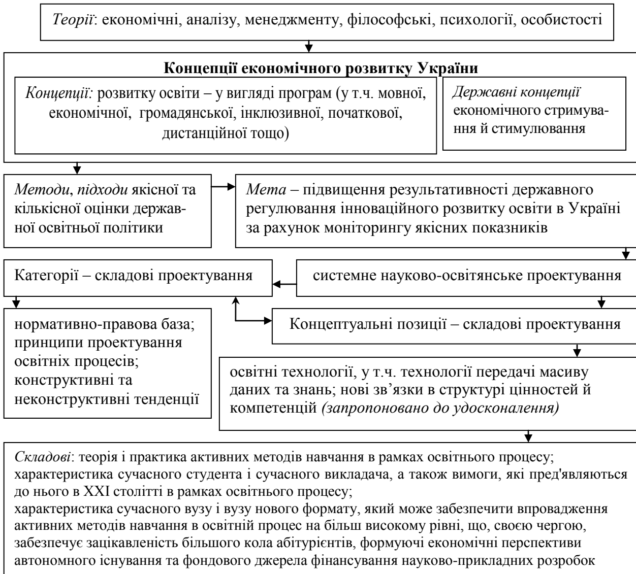
Рис. 2. Концептуальні положення науково-освітнянського проектування

освіти. Технології, які широко використовуються у Інтернет-просторі, починають показувати потенціал, допомагаючи ліквідувати ситуативні прогалини у процесах навчання. Нові технології сприяють виникненню нових педагогічних підходів, такі як неформальне та інформальне навчання. Висхідним майданчиком для реформування системи освіти стала «вища школа». Тому, в роботі удосконалено концептуальні положення науково-освітнянського проектування (на рівні університетів), основні аспекти й підходи яких можуть бути застосовані в контексті сучасного реформування середньої та загальної освіти (рис. 2).