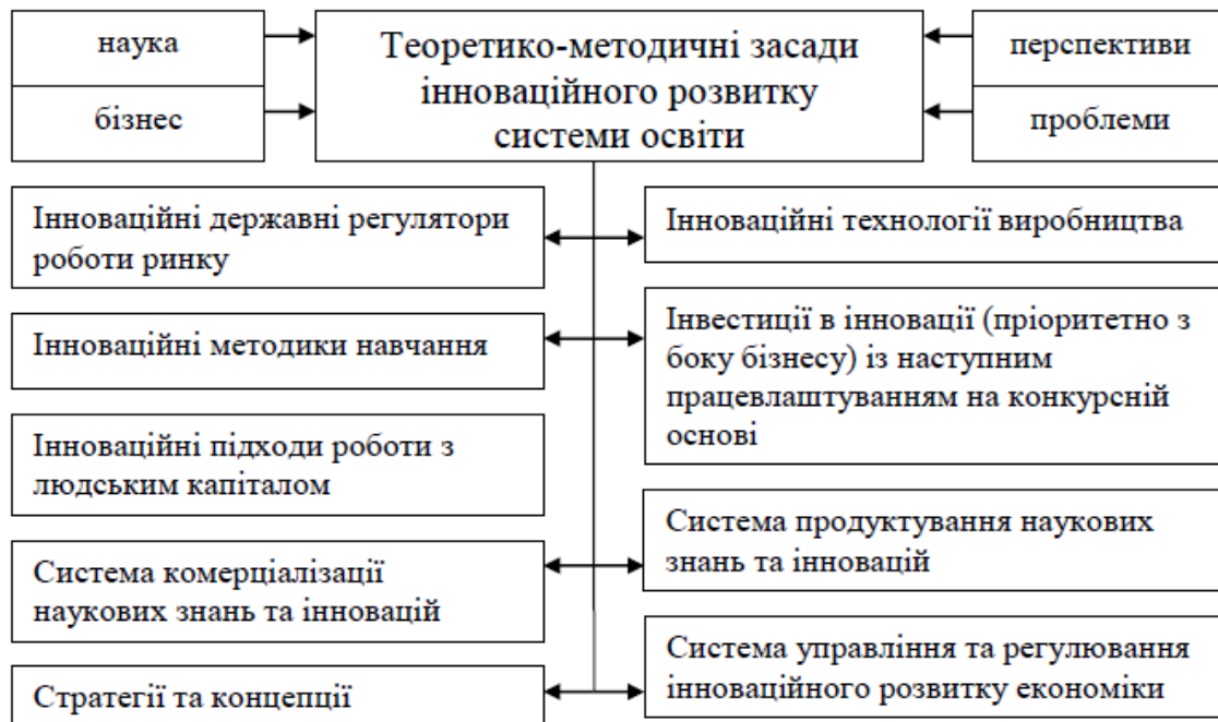
Рис. 1. Складові та фактори теоретико-методичних засад інноваційного розвитку системи освіти

Класифікаційні характеристики цілей освітнього процесу як визначального цілепокладання загальнонаціональної соціальної політики, орієнтованої на довгострокову перспективу, визначення яких дозволяє оперативнo корегувати державні стандарти освітньої діяльності та в цілому державну політику цієї сфери, дозволили систематизувати теоретико-методичні засади її інноваційного розвитку. Успішність модернізаційних процесів, ініційованих на державному рівні, значною мірою визначається теоретико-методологічною, методичною і технологічною підготовленістю педагогічних колективів та особистим ставленням вчителів (педагогів, викладачів) та учнів (студентів) до цілеспрямованої усвідомленої інноваційної діяльності. Інноваційний підхід до освіти передбачає формування сучасних компетенцій, що відрізняються від звичайних багатofункціональністю знань, міждисциплінарних умінь, освоєнням нових дій, прийомів, технологій у різних ситуаціях. Теоретико-методичні засади інноваційного розвитку системи освіти, у частині визначення інноваційності як процесу та унікальності освітніх послуг в кожний момент їх надання визначено в наступний спосіб (рис. 1).