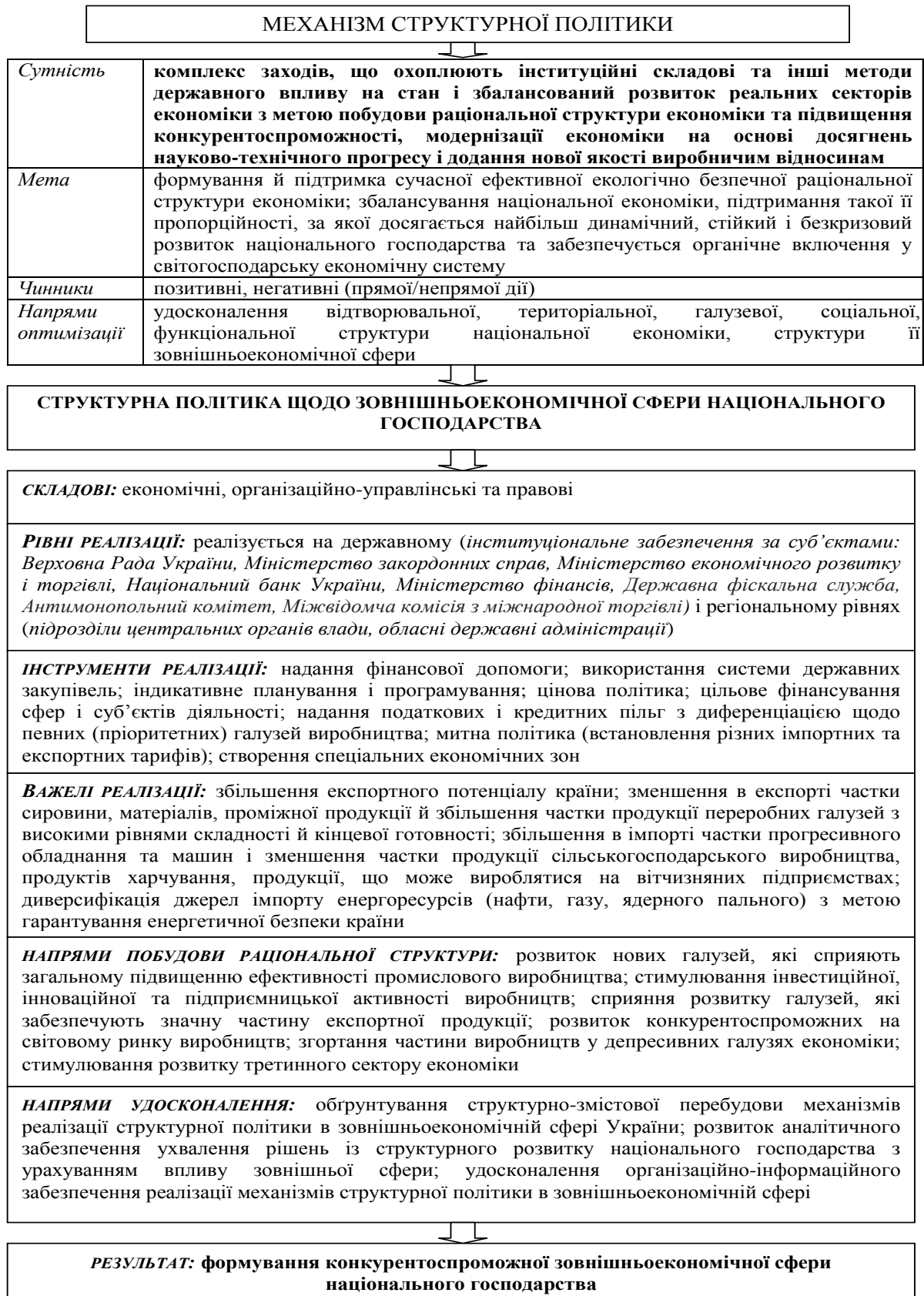
Рис. 1. Концептуальні положення з удосконалення механізму реалізації структурної політики щодо зовнішньої сфери національного господарства *