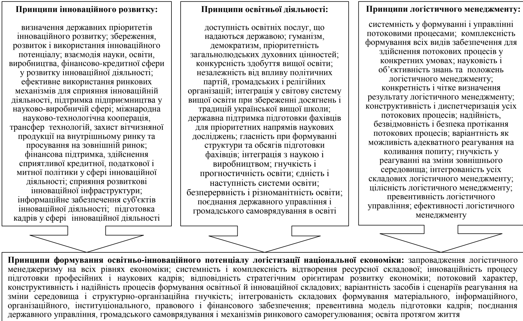
Рис. 5. Система принципів логістизації національної економіки