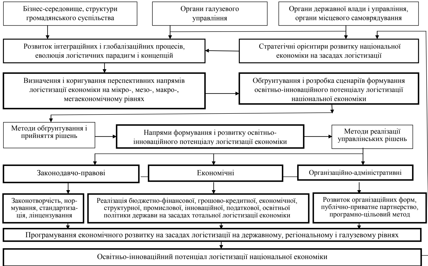
Рис. 6. Організаційно-економічний механізм реалізації стратегії формування освітньо-інноваційного потенціалу логістизації національної економіки