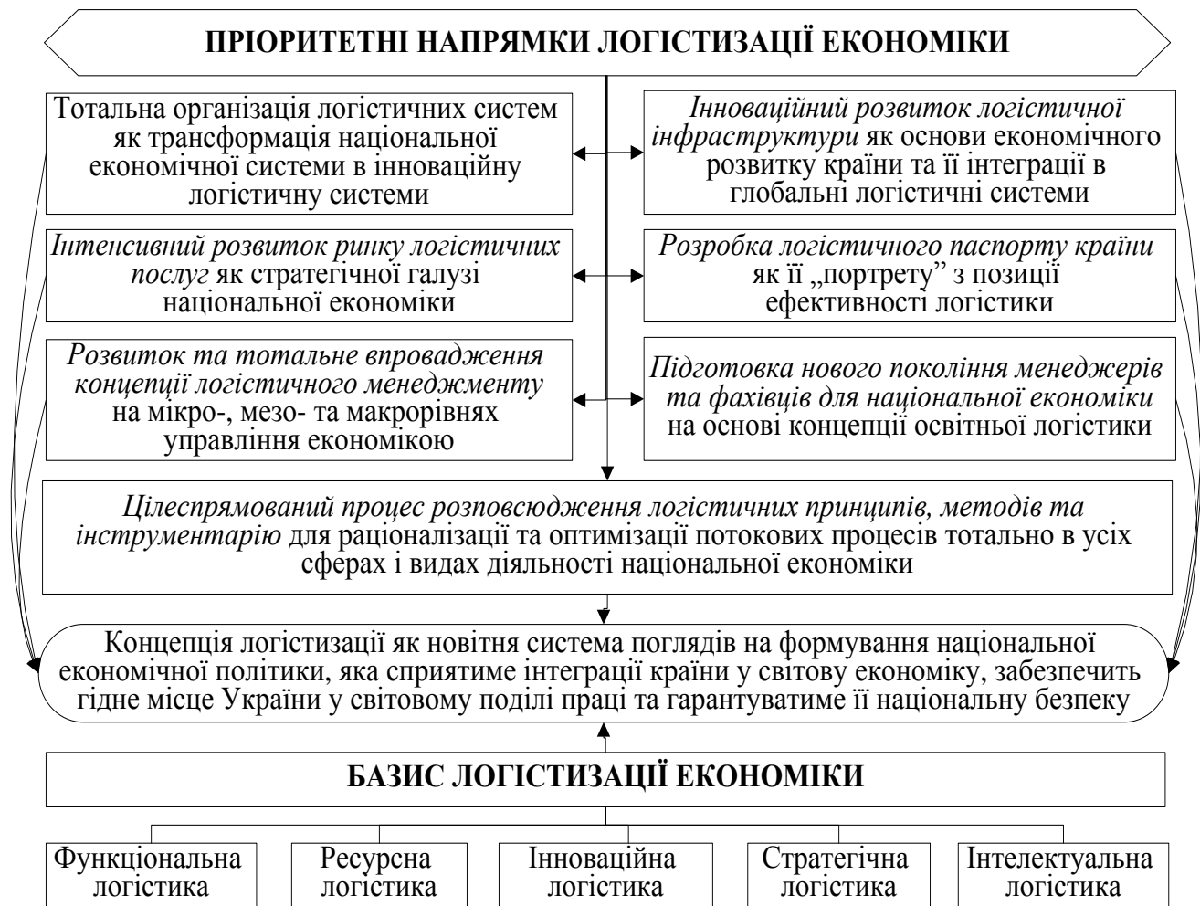
Рис. 2. Пріоритетні напрямки і фундаментальний базис логістизації національної економіки

визначення чіткого вектору входження України у глобалізаційні й інтеграційні процеси у світовій економіці, що визначатиме конфігурацію і організаційно-просторову модель формування національної логістичної системи;