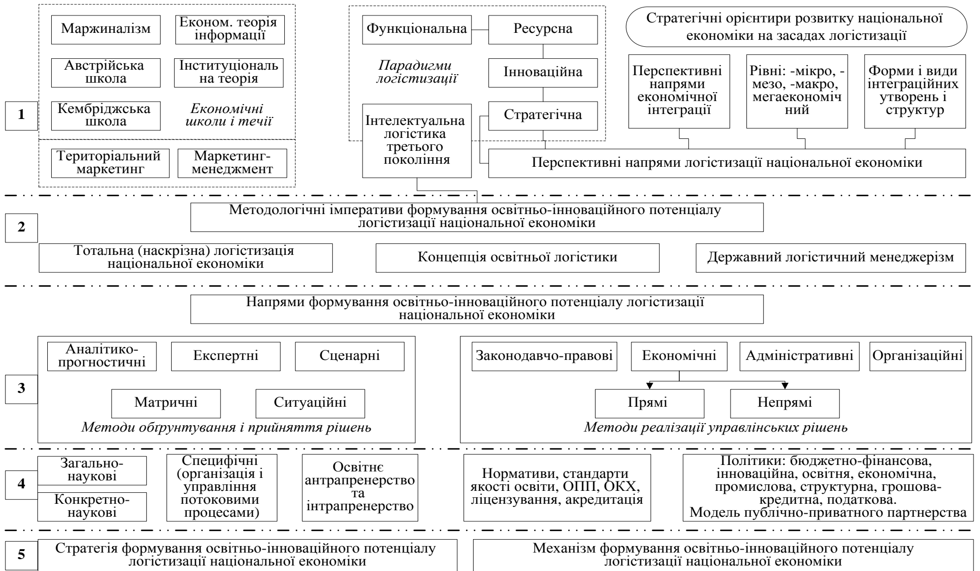
Рис. 4. Концепція формування освітньо-інноваційного потенціалу логістизації національної економіки