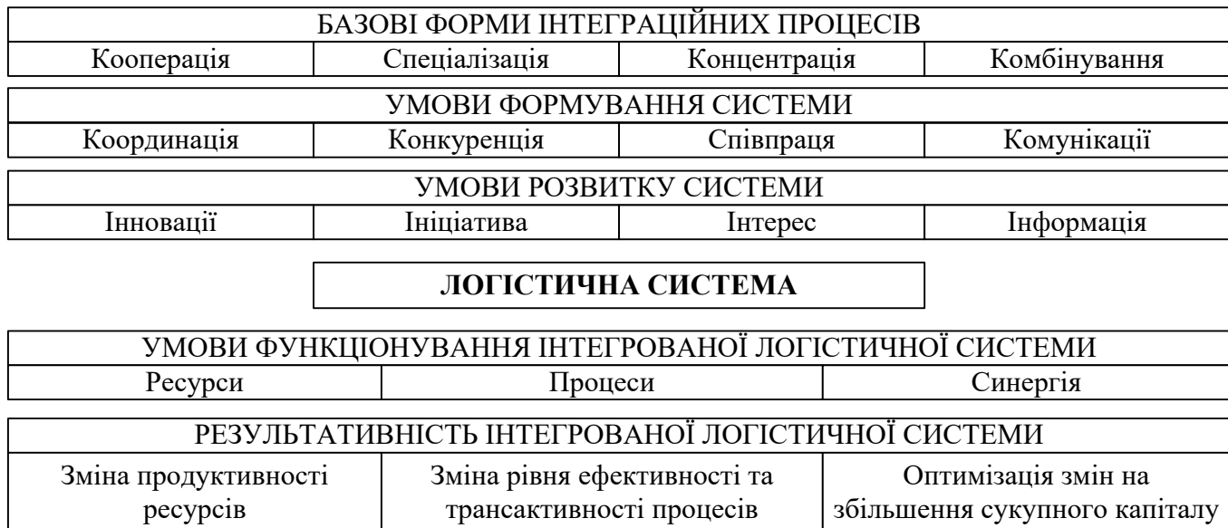
Рис. 1 – Модель формування та функціонування макроекономічної логістичної системи

на заданій території складських комплексів загального користування, вантажних терміналів, диспетчерських (логістичних) центрів; вибір виду транспорту та транспортних засобів; організація транспортування й координація роботи різних видів транспорту в транспортних вузлах; оптимізація адміністративно-територіальних розподільчих систем для багатоасортиментних матеріальних потоків, тощо. Процеси і умови формування та функціонування інтегрованої логістичної системи представлені на рис. 1.