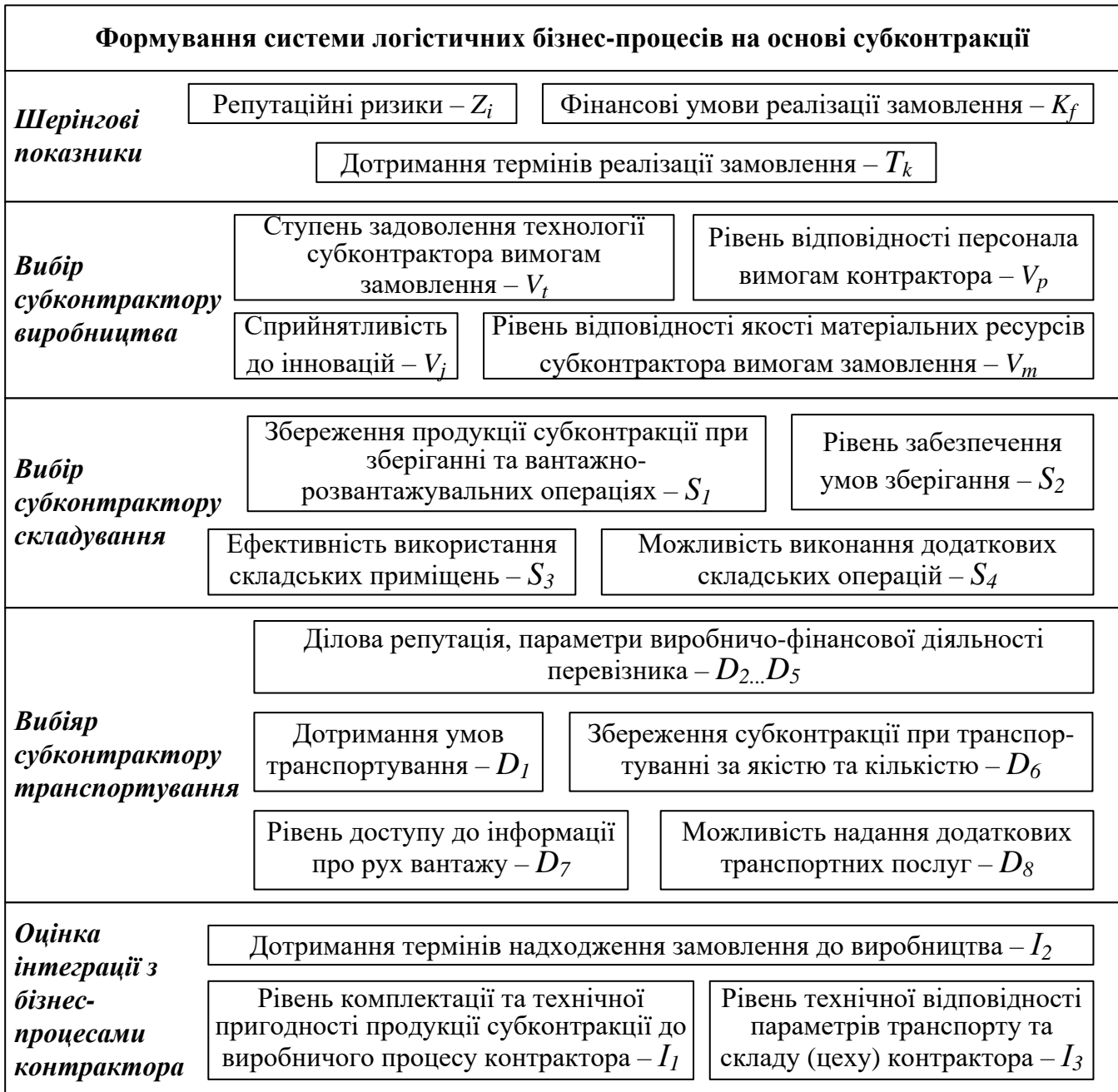
Рис. 3 – Структурна модель системи ЛБП переробної галузі

Процес субконтрактації в переробній галузі з урахуванням шерінгових показників визначає перенесення акцентів з переважно кількісних чинників, які мають чітку числову інтерпретацію, до якісних критеріїв, які відображають характер взаємодії між усіма учасниками системи ЛБП та складають основу її оптимізації. Оптимізація бізнес-процесів здійснюється шляхом вибору оптимальної логістичної схеми, виду субконтрактації, узгодження тарифів і умов оплати, визначення термінів і умов доставки, розрахунку потреби в транспортних засобах, що забезпечує мінімізацію ризиків з одночасною максимізацією якісних показників.