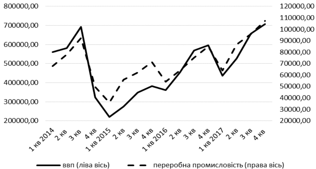
Рис. 2 – Динаміка реального ВВП та виробництва продукції переробної промисловості, 2014-2017 р., млн. грн

Стосовно питомої ваги переробної промисловості у фінансовому результаті підприємств України то, незважаючи на стабільне збільшення частки збиткових підприємств, а також різке падіння питомої ваги промисловості у фінансовому результаті підприємств України у 2015 р. до рівня 16,6 %, за результатами 2017 р., вона відновила свої позиції та досягла рівня 2012 р. – 18,4 %. В той же час рівень рентабельності підприємств переробної промисловості у 2017 році не перебільшував 4,6 %, що не дозволяє підприємствам ефективно розвиватися як самодостатнім господарським одиницям.