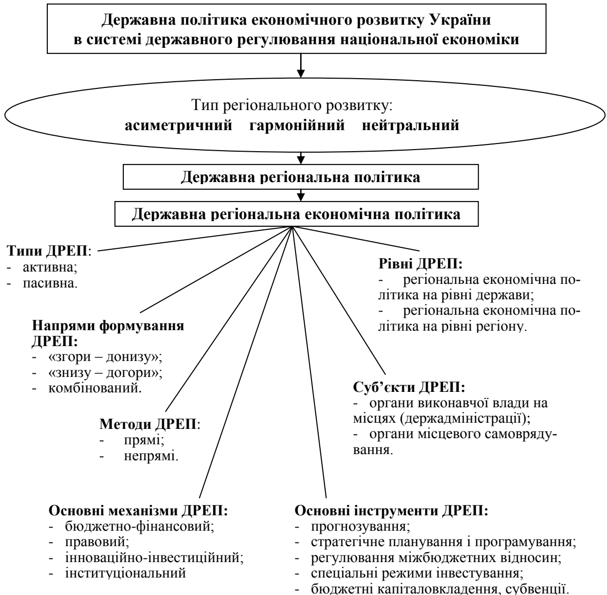
Рис. 1. Державна регіональна економічна політика як елемент системи державного регулювання національної економіки, її основні риси і складові

лювання шляхом використання територіального маркетингу, що сприятиме структурній трансформації економіки України і збалансованості довгострокового розвитку.