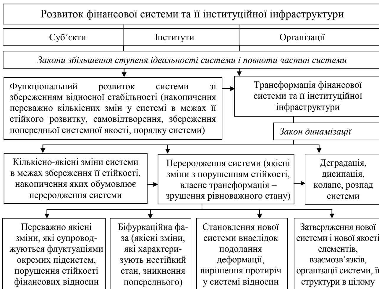
Рис. 2. Формалізація розвитку і трансформації фінансової системи та інституційної інфраструктури

Дослідження передумов і теорій, що описують трансформаційні процеси у фінансовій системі країни, дозволило відобразити еволюцію перетворених форм категорій соціально-економічних відносин, надати їх класифікаційну характеристику, механізм дії (за якісною та кількісною складовими). Відповідно систематизовано передумови і поточні результати трансформації фінансової системи та її інституційної інфраструктури за теорією криз (рис. 2).