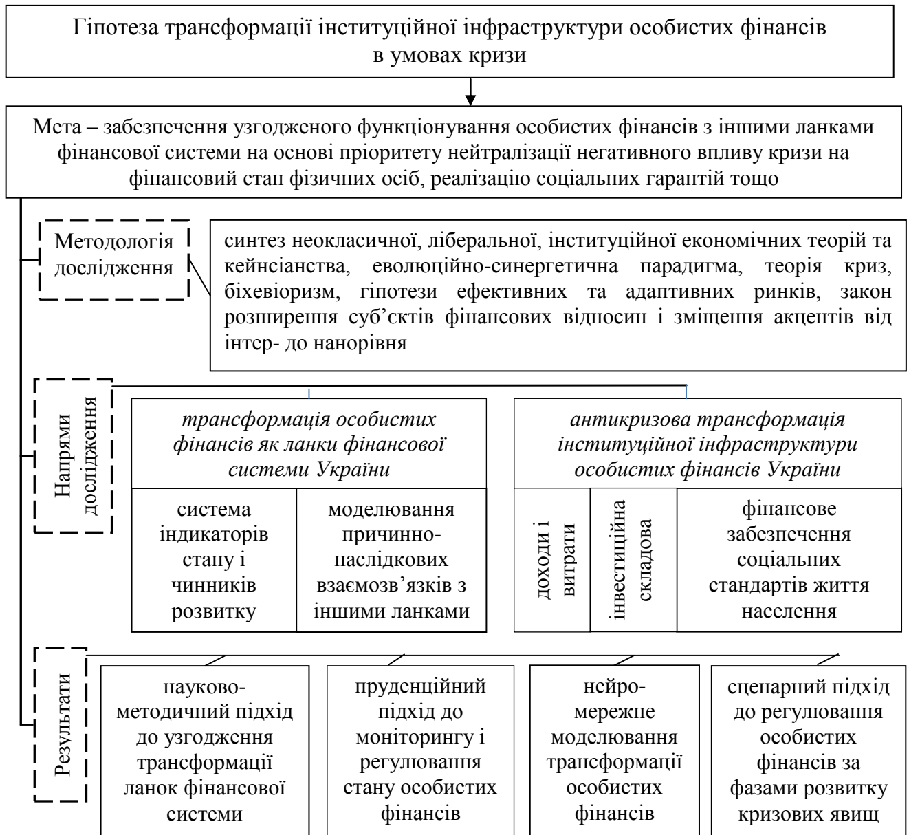
Рис. 3. Концепція антикризової трансформації інституційної інфраструктури особистих фінансів

Розроблено концепцію антикризової трансформації інституційної інфраструктури особистих фінансів в умовах кризи (рис. 3).